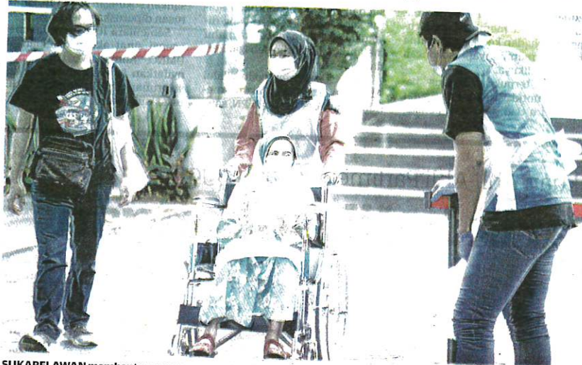
SUKARELAWAN membantu seorang warga emas yang hadir secara walk-in di Pusat Pemberian Vaksin (PPV) Bangi Avenue Convention Centre (BACC), Bangi semalam.

Ketua Pengarah Kesihatan, Tan Sri Dr. Noor Hisham Abdullah berkata, daripada jumlah kes harian semalam, sebanyak 317 kes (1.9 peratus) kategori tiga, empat dan lima, manakala 16,788 kes (98.1 peratus) daripada kategori satu dan dua.