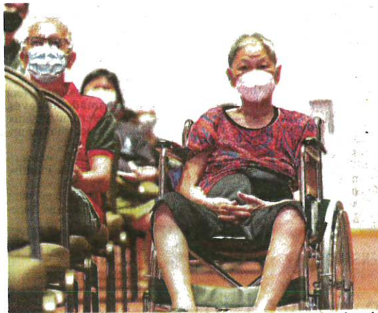
A senior citizen in a wheelchair resting after being inoculated at the SPICE Convention Centre mega vaccination centre in Bayan Baru, Penang yesterday.

He said 48 of those vaccinated were in category three (pneumonia), while 18 were in category four (pneumonia and needing oxygen). Only eight who had been inoculated were in category