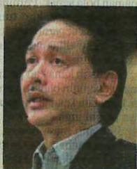
DR NOOR HISHAM

"Kes aktif di seluruh negara adalah 203,664 yang mana 1,066 pesakit ditempatkan di unit rawatan rapi (ICU) serta 537 kes me-