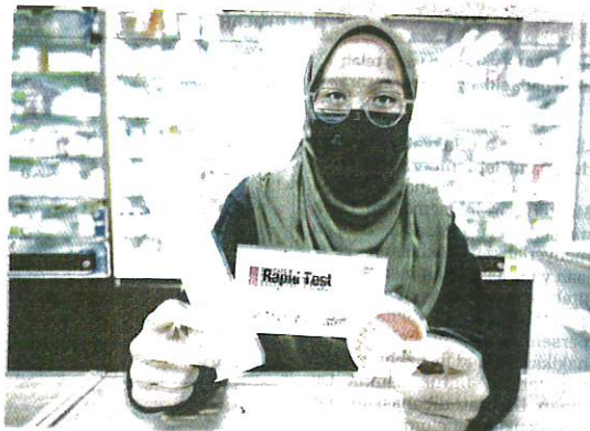
ORANG ramai kini boleh melakukan ujian saringan Covid-19 secara sendiri di rumah. - GAMBAR HIASAN

netapkan mana-mana syarikat yang diberi kelulusan bersyarat diminta supaya mengedarkan kit-kit ujian sendiri Covid-19 melalui farmasi komuniti berlesen dan fasiliti kesihatan yang dibenarkan.